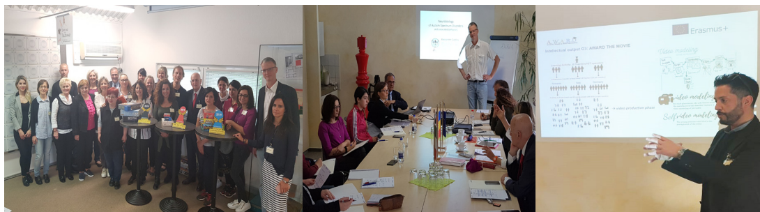
Incontro dei partner durante la learning activity a Chemnitz (Germania) - dal 20 al 24 maggio 2019