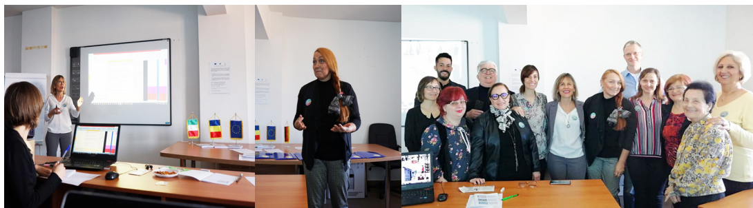
Întâlnire de proiect în Timișoara (România) 28 Martie 2019