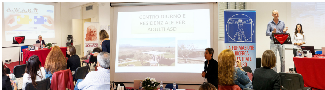
Întâlnire de proiect în Cagliari (Italia) 29 Octombrie 2018

Parteneriatul A.W.A.R.D. este alcătuit din organizații cu interese comune și care împărtășesc know-how-ul lor specific pus în slujba sprijinirii angajării tinerilor cu spectru autist.