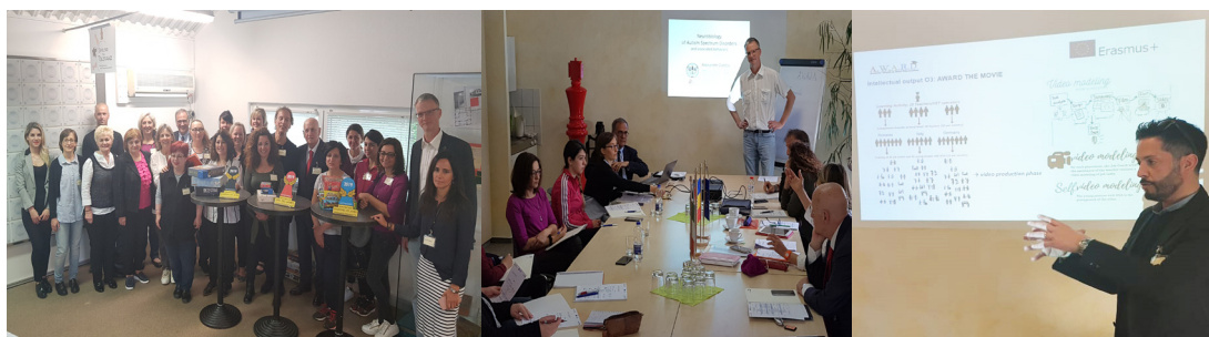
Întâlnirea partenerilor de proiect, în timpul activităților de învățare, Chemnitz (Germania) 21-24 Mai 2019